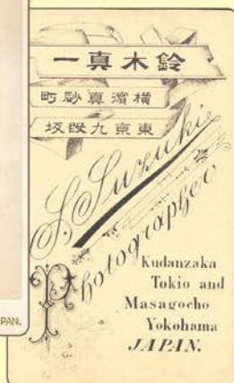
個性あふれる台紙に貼られた写真 (上：鈴木真一 撮影) (下：丸木利陽 撮影)