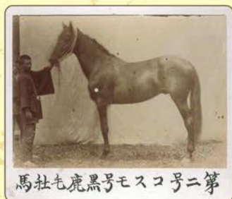
廣澤牧場で生産された馬の写真