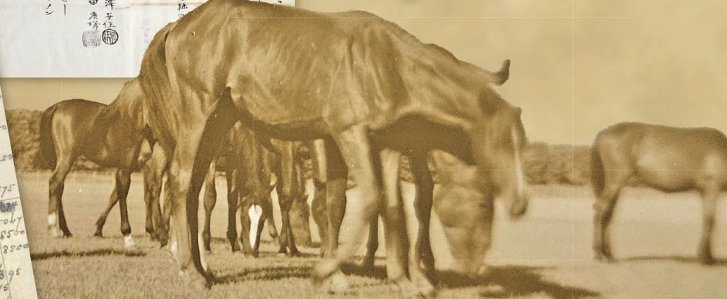
上：牧畜資金拝借願 / 中：外国人雇用条約書 / 下：ルセーによる会計簿