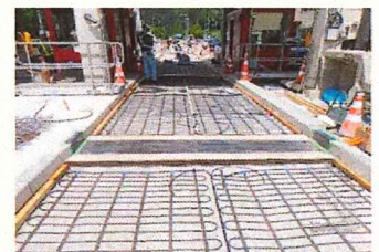
ロードヒーティング改修工事のイメージ